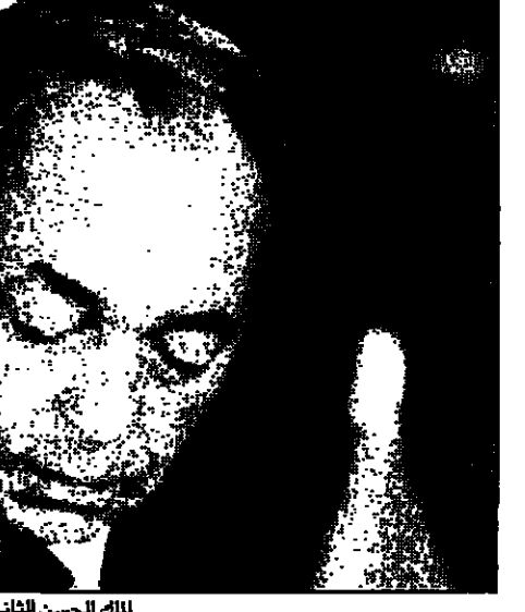
ملك الحسن الثاني

وتكر المعامل المغربي بقيام سلطات الاحتلال الاسرائيلية وبعد ثلاثة ايام من دخوله القدس بنسف حي الخارية وتسيوتها بالارض، رغم ان تكبر كان دائما قضاء لعنايش الانبياء، وقال ان تصرف حي الخارية مثال لا يكتف للمطرفون اليهود، ورمز لا حدث لسكان القدس ولا يحدث لهم كل يوم جوار تسامحهم ومواقفهم الاخلاقية النبيلة تجاه اليهود، ويرأس المعامل المغربي لجنة القدس الاسلامية التي شكلت في 1979، على مستوى وزراء الخارجية لخمس عشرة دولة اسلامية عربية وافريقية واسيوية، وقال الحسن الثاني ان اللجنة عملت في توثيق واتساع مع قرارات الجمعية العامة للأمم المتحدة ومجلس الامن الدولي التي شجبت الاحتلال الاسرائيلي للقدس الشريف واستكرت تغيير معالم المدينة كما علمت على اشد اشد للجماع الدولي بشأن ما يهدد القدس من مخاطر وذلك بالتواصل مع قادة ليبيا، لان هذه المخاطر قضية تهم العالم الاسلامي والسلمسي، وأشار الملك الحسن الثاني ان المسلمين كانوا وحدهم في القدس الشريف رمزا للتسامح واحترام اهل الكتاب، وهم الذين رغبوا احقر عن اليهود الذين كانت الدولة البيزنطية قد قرنته كما ردوا حفاظ مشاهبا كان قد فرض اربان في القرن الثامن عشر ثناء للاحتلال الصليبي للمدينة للنسبة وسحقوا لليهود بالاستيطان بها. وقال ان سلوك المسلمين في القدس ظل سلوكا واعدا عبر العصور لانه نابع من عقيدة تعتبر الديانات السماوية نبيا واحدا، لذلك قال - بحيث للديانة رمزا للتعايش النقي طوال 14 قرنا - بعد ختم خلافا خلفاء المسلمين خطة كالحقبة التي اتبعها الملك فرناندو والملكة ايزابيلا باسبانيا